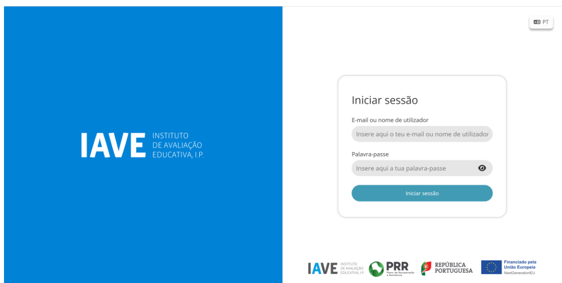
Figura 1 – Acesso à Plataforma de Realização das Provas Eletrónicas do IAVE

(Obs.: Para as escolas que optaram pelo offline em rede ou standalone, os procedimentos para acederem à Plataforma de Realização das Provas Eletrónicas do IAVE irão ser oportunamente divulgados)