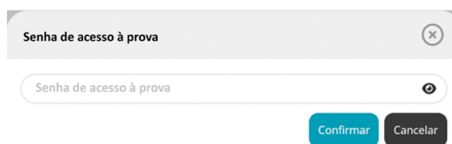
Figura 3 – Pedido da senha de acesso à prova a realizar

12.10. Depois de aceder à prova é solicitada a senha de acesso à prova. Inserindo a senha de acesso e pressionando o botão “Confirmar” a prova é iniciada.