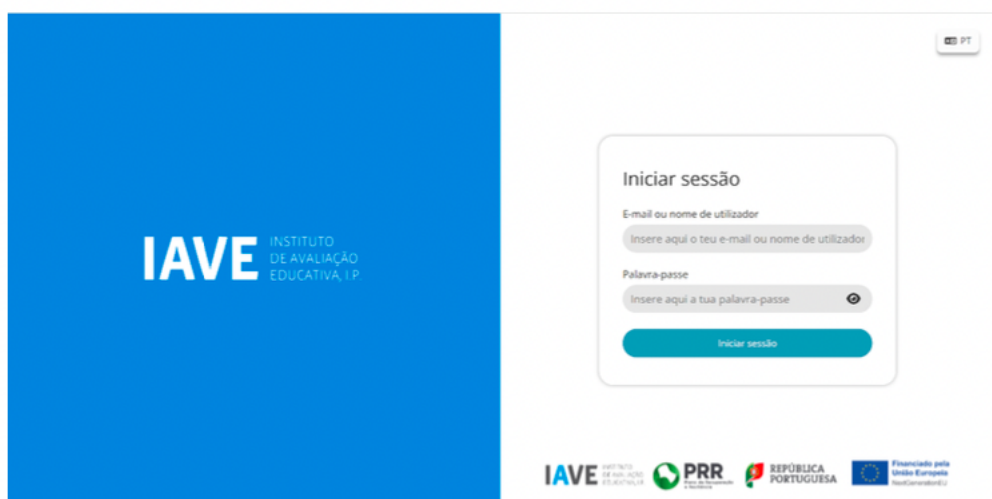
Figura 1 – Acesso à Plataforma de Realização de Provas do IAVE

c) Inserir as credenciais “Nome de utilizador” e “Palavra-passe” e, em seguida, clicar em “Aceder” ou “Iniciar sessão”.